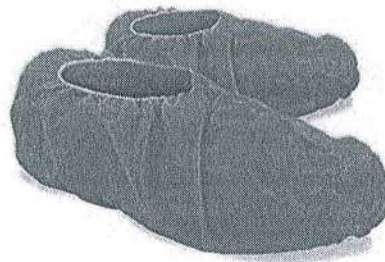
Fig.1: Cubre calzado descartable (par) (no incluye diseño)