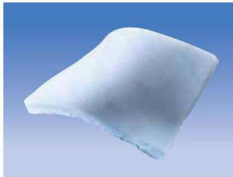
Fig.1: Esponja hemostática de colágeno (no incluye diseño)