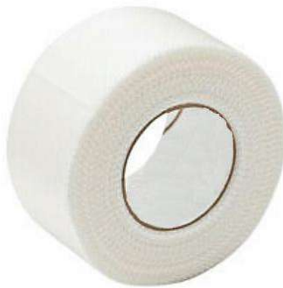
Fig.1: Esparadrapo hipoalergénico (tela) (No incluye diseño)