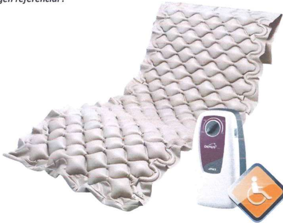
Imagen referencial :