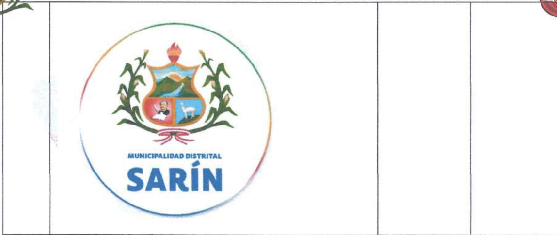
Imagen referencial :