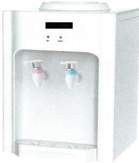
DISPENSADOR DE AGUA PORTATIL PARA BIDÓN DE