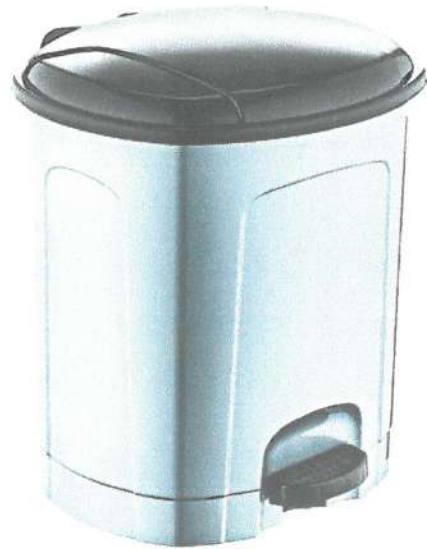
TACHO DE PLÁSTICO CON PEDAL 20 L APROX