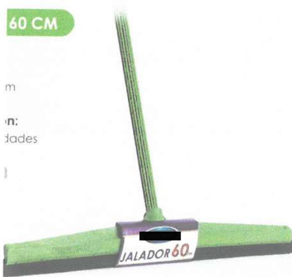
JALADOR DE AGUA DE JEBE DE 60 CM APROX