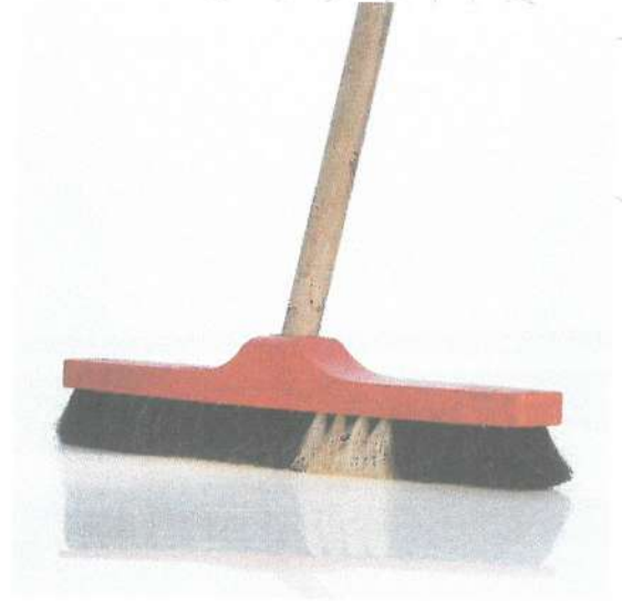
ESCOBILLÓN DE CERDAS DE PLÁSTICO O