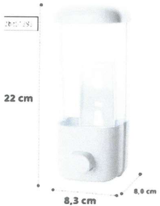
DISPENSADOR DE JABÓN LÍQUIDO (MATERIAL DE