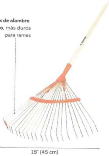
ESCOBA DE METAL PARA JARDÍN DE 18 DIENTES

Dientes de alambre redondo, más duros para ramas