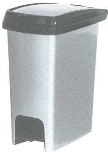
TACHO DE PLÁSTICO CON TAPA VAIVÉN O PEDAL DE 10 L APROX