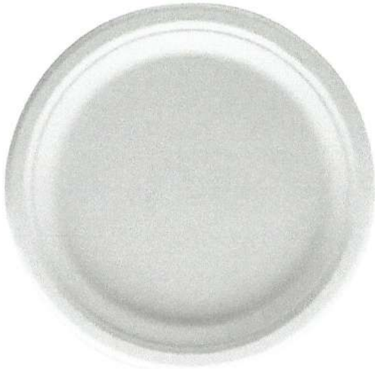
PLATO DESCARTABLE DE PLÁSTICO O BIODEGRADABLE N° 18 O N° 26