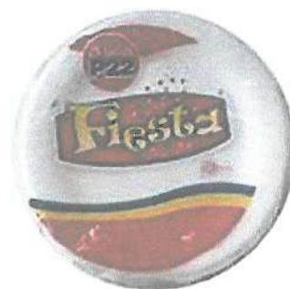
DESCARTABLE DE PLÁSTICO N° 15