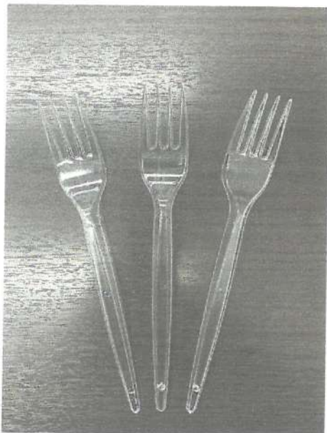
TENEDOR DESCARTABLE GRANDE