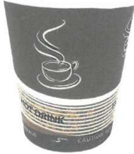
VASO DESCARTABLE DE POLIPAPEL DE 8 OZ