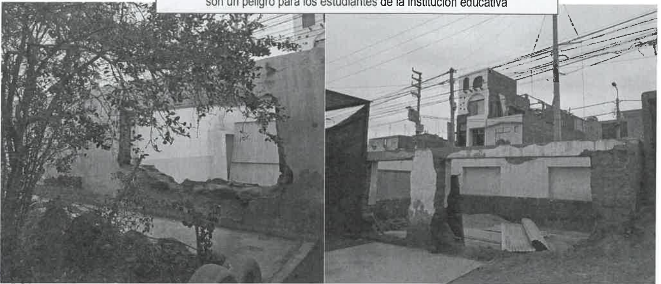
Imagen N°01: Vista Panorámica del pabellón de las aulas que colapsaron y son un peligro para los estudiantes de la institución educativa