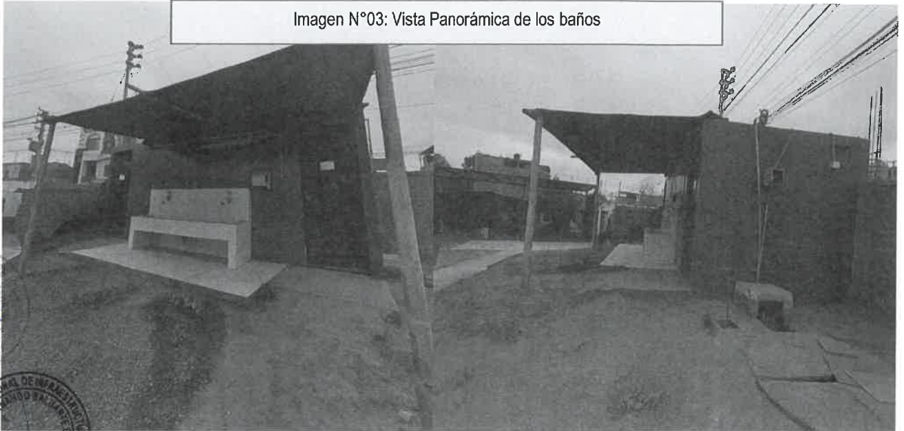
Imagen N°03: Vista Panorámica de los baños