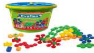
Eslabones geométricos de 20 piezas