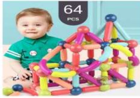
Juguete didáctico engranaje de 30 a 50 piezas