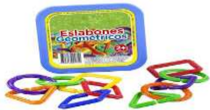
Set de aros de 12 piezas