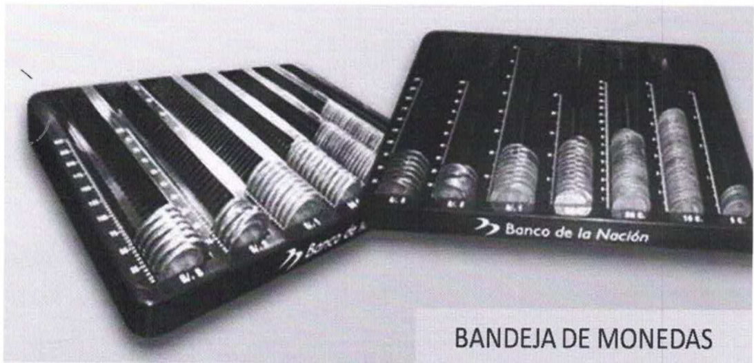
BANDEJA DE MONEDAS