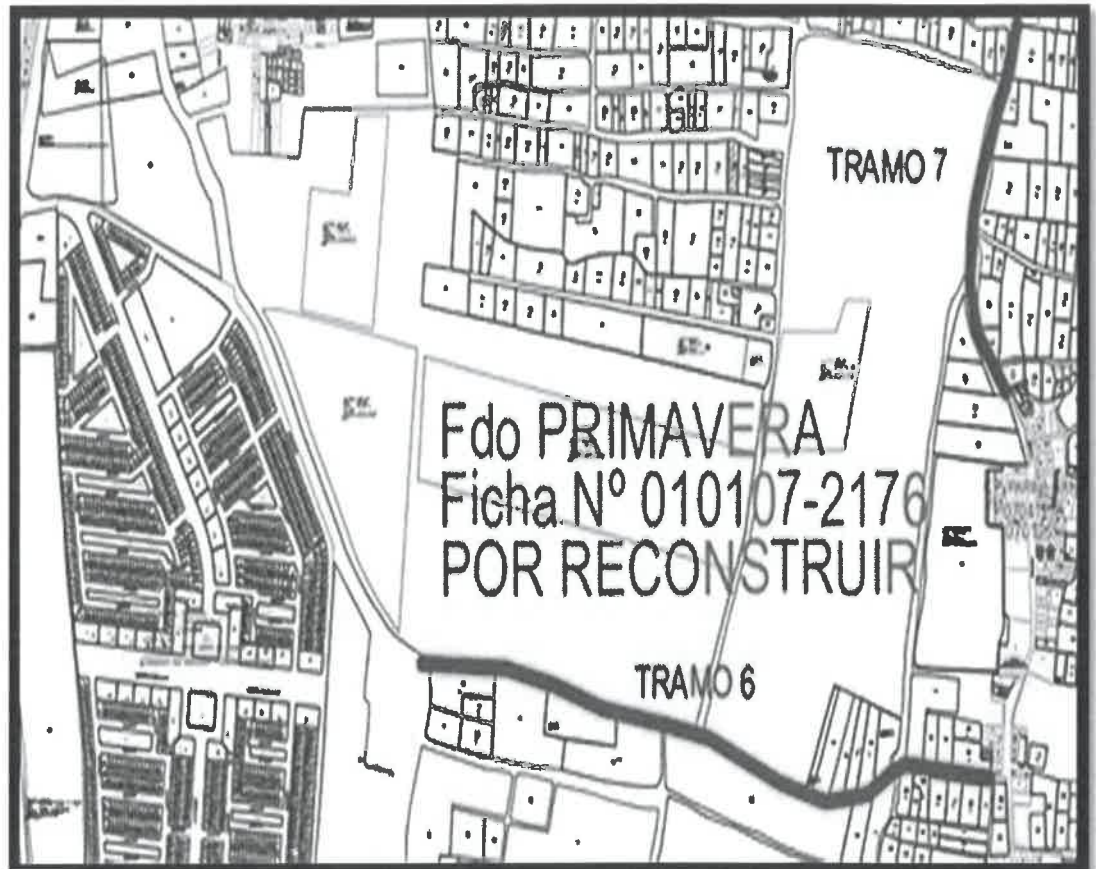
Imagen 01: Tramos considerados para el proyecto