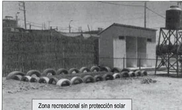
Zona recreacional sin protección solar