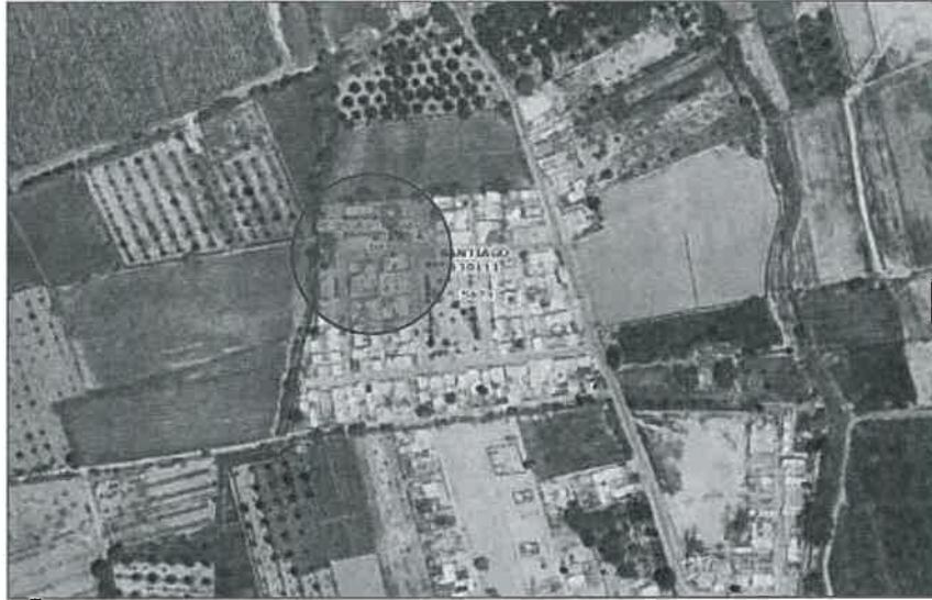
Ubicación de la institución educativa nivel inicial N°164 del Centro poblado de Sacta – distrito de Santiago, provincia de Ica, departamento de Ica.