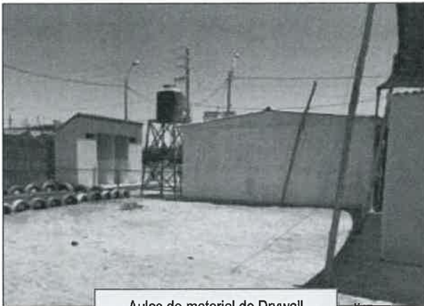
Aulas de material de Drywall