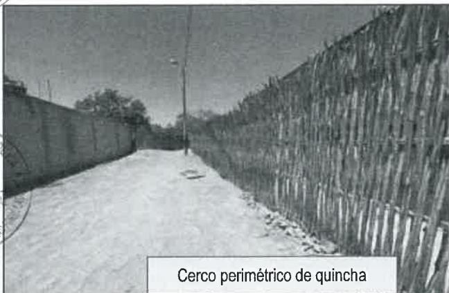
Cerco perimétrico de quincha