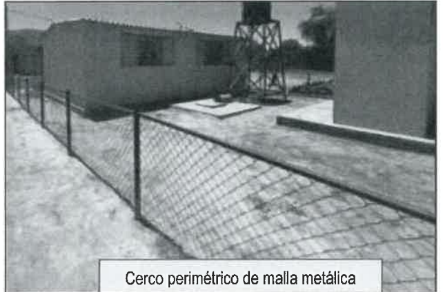
Cerco perimétrico de malla metálica