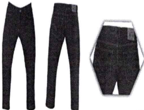
FOTO REFERENCIAL PANTALON JEAN DAMAS EN STRECH