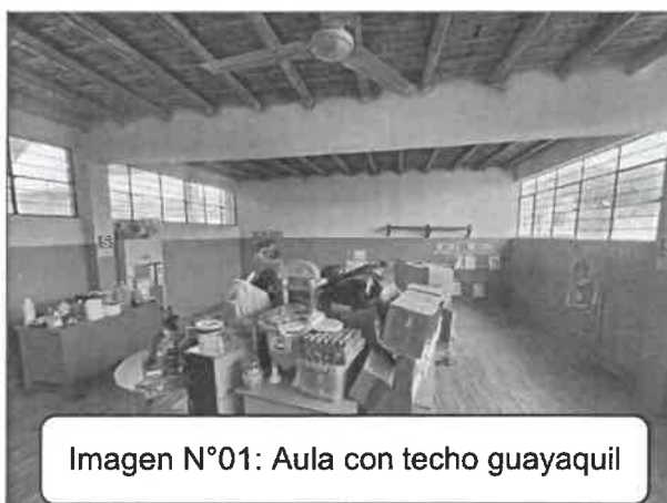
Imagen N°01: Aula con techo guayaquil

Zona administrativa: La institución educativa cuenta con 02 aulas pedagógicas en las cuales los estudiantes reciben el servicio educativo, una de estas aulas presenta como componente, el techo de material de caña guayaquil, por medio del cual existen filtraciones al interior del aula, lo cual afecta tanto el equipamiento y mobiliario educativo como el bienestar de los estudiantes. Así como se visualiza a continuación: