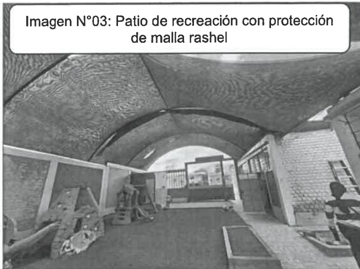
Imagen N°03: Patio de recreación con protección de malla rashel

Cerco perimétrico: La institución educativa cuenta con cerco perimétrico en su fachada principal y lateral derecho, así mismo realizada las coordinaciones, la directora de la institución educativa manifestó que el área del terreno de la I.E. abarca hasta los módulos existentes colindantes, por lo cual se identificó que dicha área carece de cerco perimétrico. Así como se visualiza a continuación: