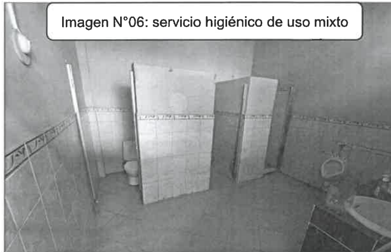
Imagen N°06: servicio higiénico de uso mixto

Cocina: La institución educativa cuenta con una cocina, que a la vez tiene uso de depósito, el cual no presenta las condiciones mínimas, ya que no cuenta con una correcta ventilación e iluminación para la actividad destinada, así mismo se identificó que el techo es de material guayaquil mediante el cual se presenta filtraciones que afectan a los productos almacenados.