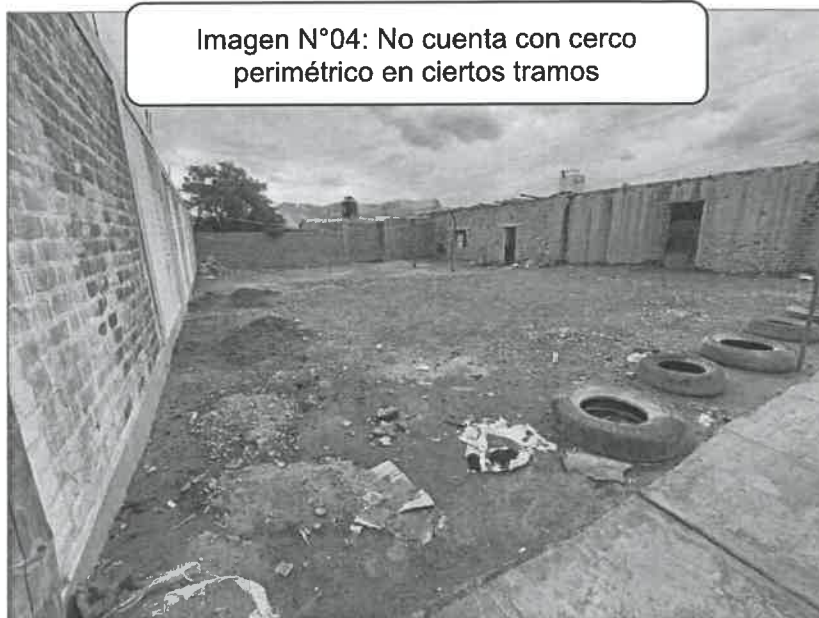
Imagen N°04: No cuenta con cerco perimétrico en ciertos tramos

Cerco perimétrico: La institución educativa cuenta con cerco perimétrico en su fachada principal y lateral derecho, así mismo realizada las coordinaciones, la directora de la institución educativa manifestó que el área del terreno de la I.E. abarca hasta los módulos existentes colindantes, por lo cual se identificó que dicha área carece de cerco perimétrico. Así como se visualiza a continuación: