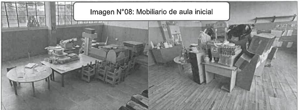
Imagen N°08: Mobiliario de aula inicial

De acuerdo a lo identificado en la inspección, se concluye que la institución educativa nivel inicial N°154 no cumple con las condiciones mínimas establecidas en la normativa vigente, puesto que los ambientes existentes no presentan las condiciones mínimas para el adecuado desarrollo del servicio, así como su equipamiento y mobiliario, además se constató la carencia de ambientes básicos y complementarios, de acuerdo a lo establecido en Resolución Viceministerial N°010-2022-MINEDU, "Criterios Generales de Diseño para Infraestructura Educativa", Resolución Viceministerial N°104-2019-MINEDU, "Criterios de Diseño para locales educativos del nivel de Educación inicial" y Norma Técnica denominada "Criterios de Diseño para Mobiliario Educativo de la Educación Básica Regular", aprobado con Resolución Viceministerial N°019-2023-MINEDU.