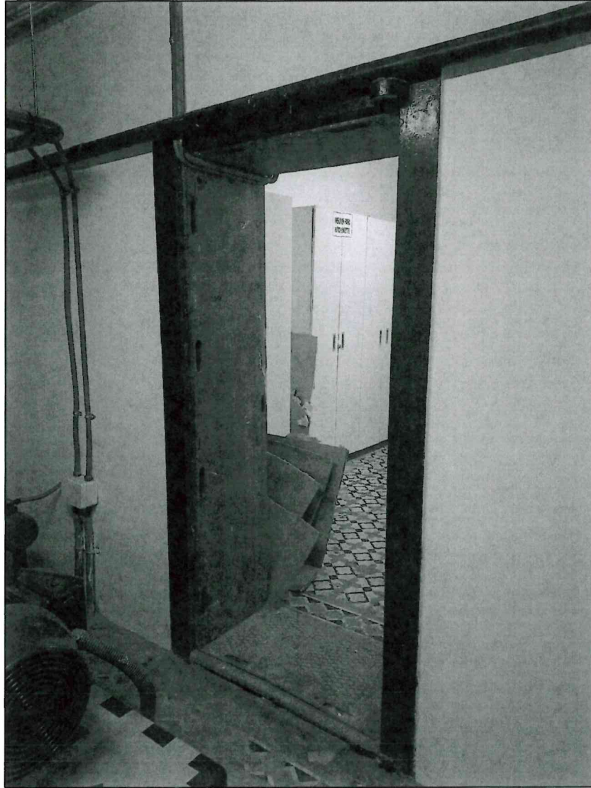
IMAGEN 1 Lugar de Intervención e instalación de puerta.