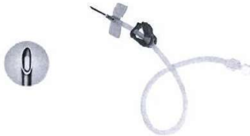
Fig. 1: Aguja para Fístula Arterio-Venosa con Fenestra (Imagen referencial)