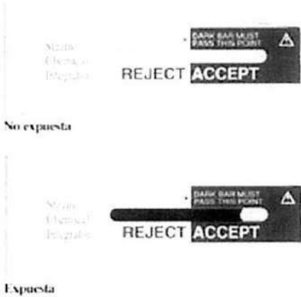
Fig. 1.: Integrador químico de vapor tipo V (no incluye diseño)