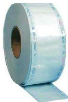
Fig.1: Manga mixta para esterilización (imagen referencial)