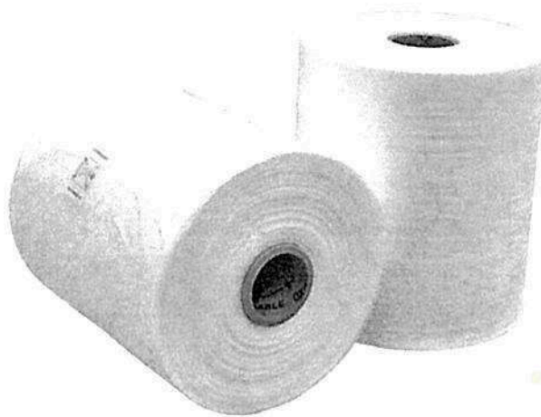
Fig. 1.: Manga de polietileno (no incluye diseño)