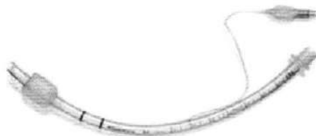
Fig 1.: Tubo Endotraqueal con Globo (no incluye diseño)