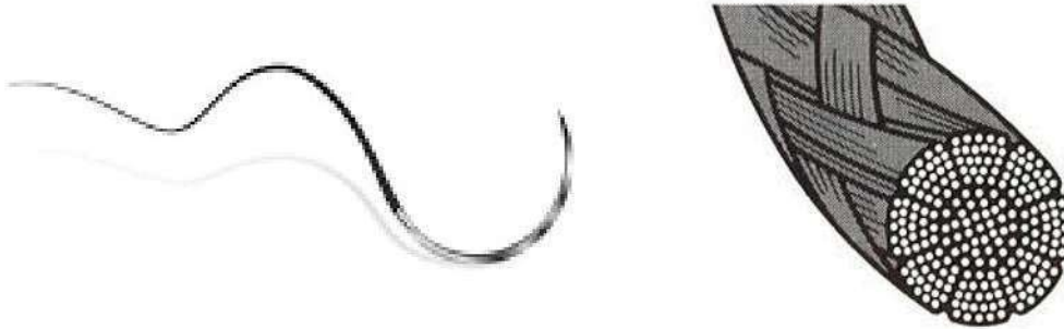
Fig. 1: Sutura de seda negra trenzada (imagen referencial, no incluye diseño)