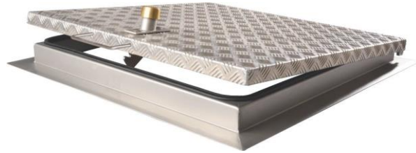
Modelo de tapa a instalar