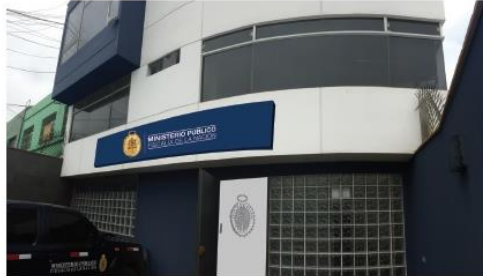
*LA MEDIDA DEL LETRERO DEPENDE DEL TAMAÑO DE LA FACHADA. MANTENER MEDIDAS PROPORCIONALES